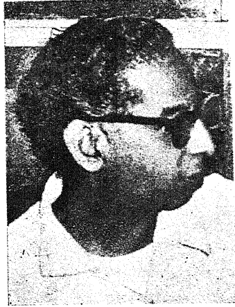
सैयद सज्जाद जहीर